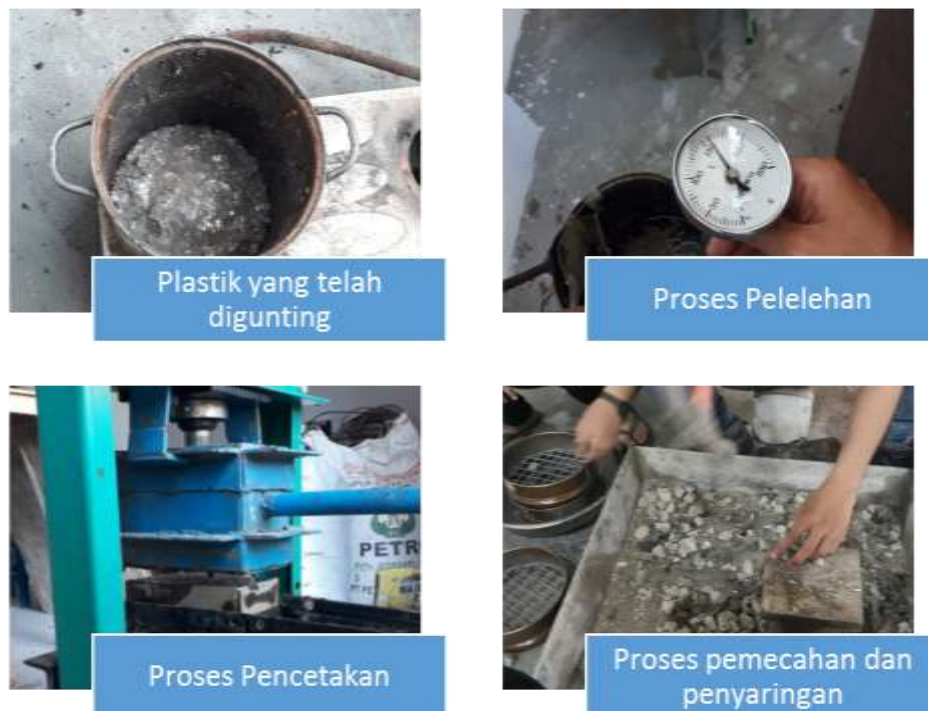
Gambar 1. Proses pengolahan kerikil plastik.

Proses pengolahan kerikil plastik dapat dilihat pada Gambar 1.