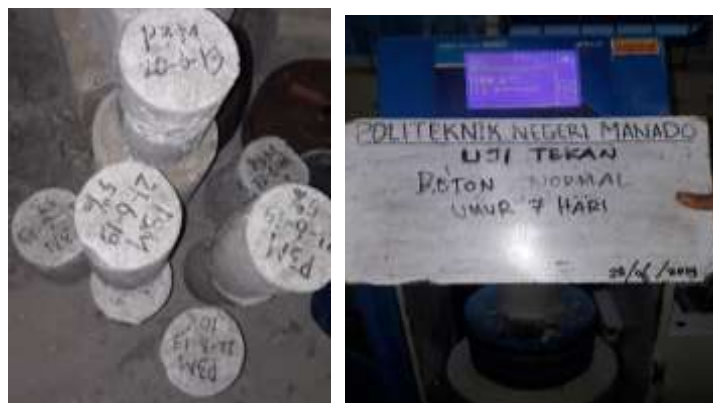
Gambar 2. Pengujian kuat tekan menggunakan mesin compressiontest