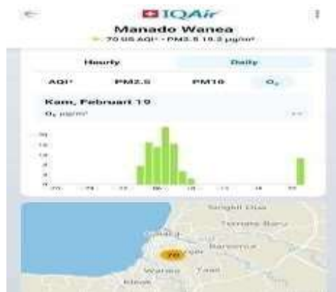
Gambar 7 Ozon Permukaan (19 Februari 2026)

Pada gambar 5 nilai Indeks Kualitas Udara AQI US pada hari Kamis, 19 Februari, menunjukkan tren yang sangat stabil dan homogen. Sepanjang periode pengamatan dari pagi hingga malam hari, indeks kualitas udara secara konstan bertahan di angka 70 US AQI. Konsistensi nilai ini menempatkan kondisi atmosfer di lokasi penelitian sepenuhnya berada dalam Kategori Sedang. Gambar 6 pada hari Kamis, 19 Februari, menunjukkan pola distribusi temporal yang sangat stabil. Konsentrasi PM2.5 tercatat konsisten berada di angka 19,3 µg/m 3 sepanjang hari, dari pagi hingga malam hari. Representasi grafik batang yang sepenuhnya berwarna kuning menegaskan bahwa akumulasi polutan halus ini berada dalam Kategori Sedang.