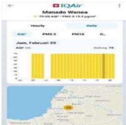
Gambar 10 Kualitas Udara (20 Februari 2026)