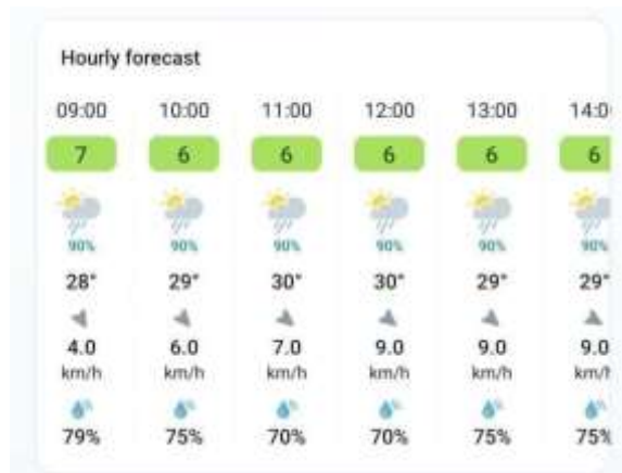
Gambar 13 Keterangan cuaca, suhu, angin, dan kelembaban (20 Februari 2026)

Pada Gambar 13 dapat diketahui dari pukul 09.00 hingga 14.00 dicirikan oleh probabilitas curah hujan yang sangat tinggi dan konstan di angka 90%. Parameter fisik atmosfer menunjukkan interaksi yang dinamis, di mana kenaikan suhu udara mencapai puncaknya pada angka 30°C di tengah hari (pukul 11.00–12.00) secara simultan menekan kelembapan udara ke titik terendah sebesar 70%. Peningkatan suhu ini juga linier dengan penguatan kecepatan angin yang mencapai batas maksimum sebesar 9.0 km/h pada pukul 12.00–14.00. Di sisi lain, nilai indeks parameter lingkungan cenderung stabil dengan penurunan minor dari angka 7 di pagi hari menjadi konstan di angka 6 sejak pukul 10.00 hingga siang hari."