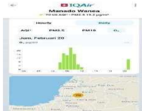
Gambar 12 Ozon Permukaan (20 Februari 2026)

Pada gambar 10 Kualitas Udara AQI US pada hari Jumat, 20 Februari, memperlihatkan pola sebaran yang sangat stabil dan konstan. menunjukkan bahwa nilai indeks 70 US AQI dari pagi hingga malam hari, menempatkan kondisi kualitas udara atmosfer secara konsisten dalam Kategori Sedang. Gambar 11 pada hari Jumat, 20 Februari, menunjukkan stabilitas emisi yang tinggi. Konsentrasi PM2.5 terpantau konsisten berada di angka 19,1 \mu\text{g}/\text{m}^3 sepanjang pengamatan harian. Representasi grafik batang yang sepenuhnya berwarna kuning mengindikasikan bahwa akumulasi polutan halus ini berada dalam Kategori Sedang.