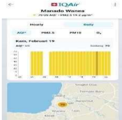
Gambar 5 Kualitas Udara (19 Februari 2026)