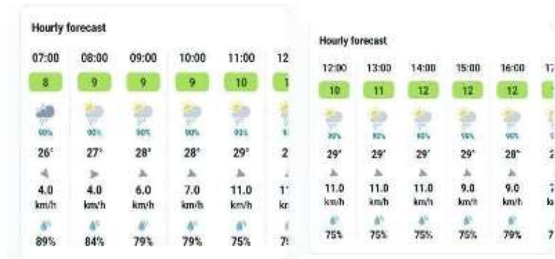
Gambar 9 Keterangan cuaca, suhu, angin, dan kelembaban (19 Februari 2026)

seluruh representasi grafik batang harian menunjukkan warna hijau yang merepresentasikan Kategori Bagus. Distribusi fluktuasi per jam terlihat sangat homogen dari pagi hingga malam hari, mencerminkan tidak adanya lonjakan aktivitas antropogenik yang signifikan terkait debu atau partikel kasar.