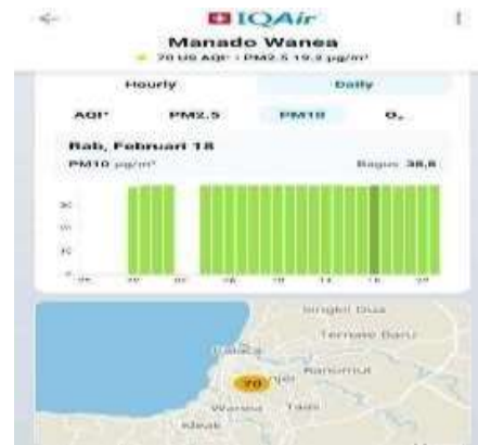
Gambar 3 Partikel debu lebih besar <10 mikrometer (18 Februari 2026)

Gambar 2 parameter Ozon \text{O}_3 pada hari Kamis, 19 Februari, menunjukkan pada waktu pagi hari (pukul 04.00–10.00) dengan puncak akumulasi tertinggi dicapai pada pukul 07.00 pagi. Seluruh visualisasi grafik batang yang berwarna hijau menegaskan bahwa paparan ozon di lokasi penelitian secara konsisten berada dalam Kategori Baik. Gambar 3 diketahui partikel debu lebih