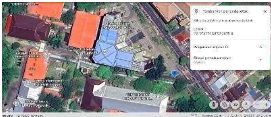
Gambar 1. Daerah Lokasi Penelitian

Merujuk pada visualisasi Google Maps yang tertera pada Gambar 1, kompleks Politeknik Negeri Manado ini terletak secara geografis di sekitar koordinat 1^{\circ}29' LU dan 124^{\circ}54' BT. Posisi ini juga terpantau berdekatan dengan koridor transportasi utama, sebuah faktor lingkungan yang berpotensi besar memberikan pengaruh terhadap karakteristik udara setempat. Pemanfaatan peta lokasi dalam penelitian ini berfungsi untuk menyajikan gambaran spasial yang jelas mengenai sebaran titik pengamatan serta pemetaan kondisi lingkungan sekitar yang berpeluang memengaruhi mutu udara di lokasi penelitian.