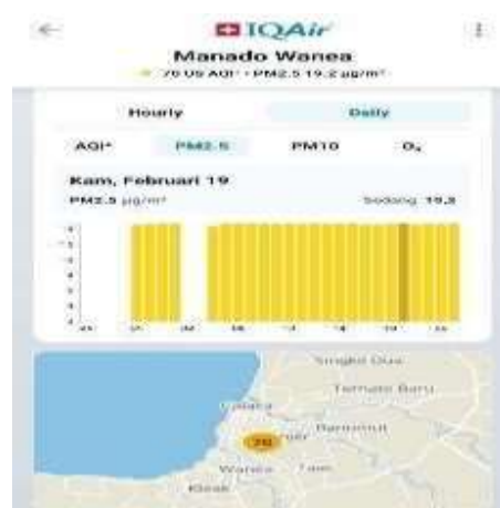
Gambar 6 Partikel debu sangat halus (<2.5 mikrometer) (19 Februari 2026)

Pada gambar 5 nilai Indeks Kualitas Udara AQI US pada hari Kamis, 19 Februari, menunjukkan tren yang sangat stabil dan homogen. Sepanjang periode pengamatan dari pagi hingga malam hari, indeks kualitas udara secara konstan bertahan di angka 70 US AQI. Konsistensi nilai ini menempatkan kondisi atmosfer di lokasi penelitian sepenuhnya berada dalam Kategori Sedang. Gambar 6 pada hari Kamis, 19 Februari, menunjukkan pola distribusi temporal yang sangat stabil. Konsentrasi PM2.5 tercatat konsisten berada di angka 19,3 µg/m 3 sepanjang hari, dari pagi hingga malam hari. Representasi grafik batang yang sepenuhnya berwarna kuning menegaskan bahwa akumulasi polutan halus ini berada dalam Kategori Sedang.