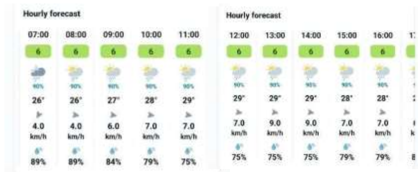
Gambar 4 Keterangan cuaca, suhu, angin, dan kelembaban (18 Februari 2026)

besar <10 mikrometer menunjukkan Indeks Kualitas Udara global (AQI) di angka 70 US AQI (Kategori Sedang/Moderate), dengan polutan utama harian secara keseluruhan yang dipicu oleh PM2.5 sebesar 19.2 \mu\text{g}/\text{m}^3 . Bagian tengah menampilkan grafik harian khusus untuk polutan PM10. Konsentrasi Tertera angka 38,8 \mu\text{g}/\text{m}^3 dengan keterangan status "Bagus" dan seluruh batang grafik dari jam ke jam berwarna hijau cerah. Ini mengindikasikan bahwa konsentrasi debu atau partikel kasar (PM10) di udara sepanjang hari itu sepenuhnya berada dalam ambang batas yang aman dan sehat bagi masyarakat.