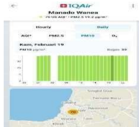
Gambar 8 Partikel debu lebih besar <10 mikrometer (19 Februari 2026)

Pada gambar 7 dari hasil pengamatan Ozon O 3 kamis, 19 Februari, pagi hari (pukul 04.00–10.00) dengan puncak akumulasi tertinggi dicapai pada pukul 07.00 pagi. Seluruh visualisasi grafik batang yang berwarna hijau menegaskan bahwa paparan ozon di lokasi penelitian secara konsisten berada dalam Kategori Baik. Pada Gambar 8 partikel debu lebih besar <10 mikrometer yang dilakukan pada hari Kamis, 19 Februari, mengindikasikan kondisi atmosfer yang sangat terkendali. Konsentrasi rata-rata harian PM10 tercatat sebesar 39 µg/m 3 dengan