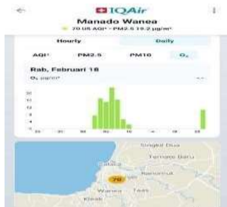
Gambar 2 Ozon Permukaan (18 Februari 2026)

Berdasarkan hasil pengukuran parameter kualitas udara pada tanggal 18 Februari 2026 yang disajikan dalam Tabel 1, secara umum kualitas udara di lokasi penelitian berada pada tingkat yang relatif stabil. Pada pengamatan pagi hari, nilai AQI US tercatat sebesar 67 dengan konsentrasi PM2.5 sebesar 19 dan PM10 sebesar 37,9. Memasuki siang hari, terjadi peningkatan fluktuasi minor pada seluruh parameter partikulat, di mana PM2.5 naik menjadi 19,2 dan PM10 meningkat menjadi 38,8, yang berimplikasi pada kenaikan nilai AQI US menjadi 70. Di sisi lain, parameter ozon \text{O}_3 tidak menunjukkan adanya pergerakan nilai (tetap berada pada angka 0). Secara keseluruhan, dinamika perubahan parameter dari pagi hingga siang hari ini tidak mengubah status kualitas udara, yang secara konsisten bertahan pada Kategori Sedang."