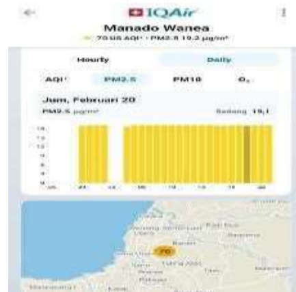
Gambar 11 Partikel debu sangat halus (>2,5 mikrometer) (20 Februari 2026)

Pada gambar 10 Kualitas Udara AQI US pada hari Jumat, 20 Februari, memperlihatkan pola sebaran yang sangat stabil dan konstan. menunjukkan bahwa nilai indeks 70 US AQI dari pagi hingga malam hari, menempatkan kondisi kualitas udara atmosfer secara konsisten dalam Kategori Sedang. Gambar 11 pada hari Jumat, 20 Februari, menunjukkan stabilitas emisi yang tinggi. Konsentrasi PM2.5 terpantau konsisten berada di angka 19,1 \mu\text{g}/\text{m}^3 sepanjang pengamatan harian. Representasi grafik batang yang sepenuhnya berwarna kuning mengindikasikan bahwa akumulasi polutan halus ini berada dalam Kategori Sedang.