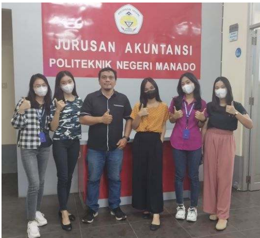
Gambar 2. Tim Pengabdian PPM-M