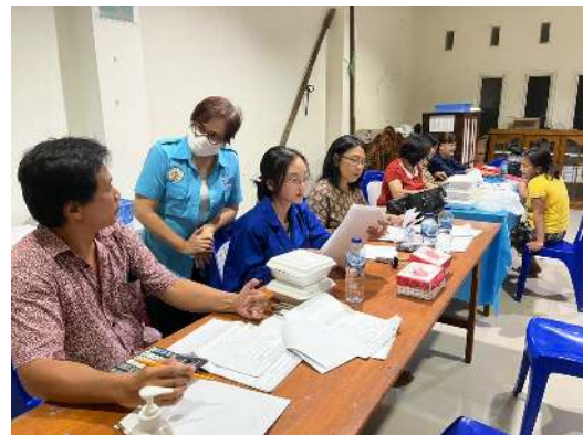
Gambar 6. Pendampingan Pemeriksaan