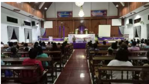
Gambar 4. Sosialisasi