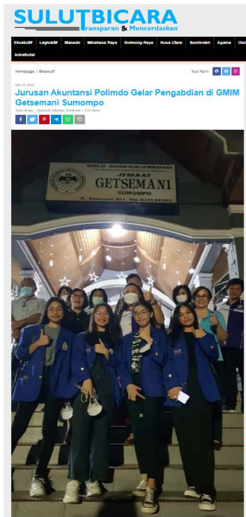
Gambar 8. Publikasi Media Online