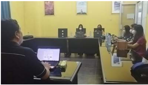
Gambar 1. Pembekalan Mahasiswa