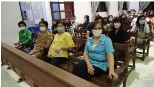
Gambar 3. Sosialisasi