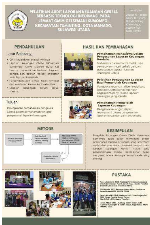
Gambar 9. Poster Digital