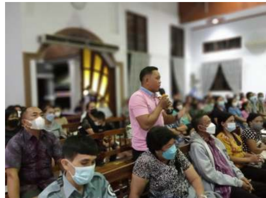
Gambar 5. Sosialisasi