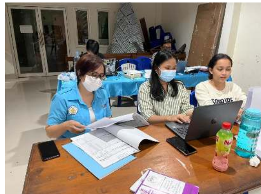
Gambar 7. Pendampingan Pemeriksaan