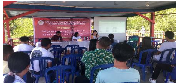
Gambar 5.1. Perabgkat Bumdes dan Perangkat Desa