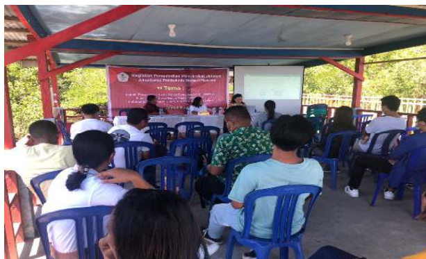
Gambar 5.3. Dosen Politeknik Negeri Manado