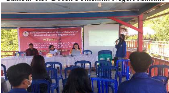
Gambar 5.4. Mahasiswa Politeknik Negeri Manado

Dari Data laporan keuangan yang masuk kami mendapatkan jumlah omzet 3 bulan terakhir seperti dibawah ini dan langsung melakukan perhitungan :