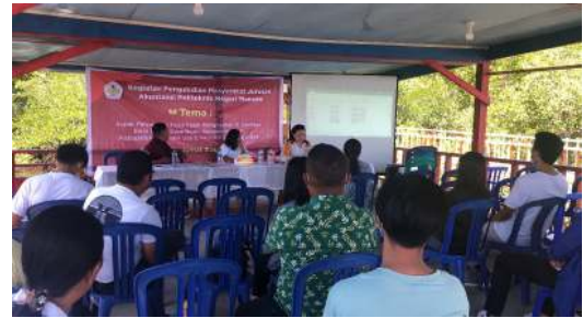
Gambar 5.2. Perangkat Bumdes dan Perangkat Desa